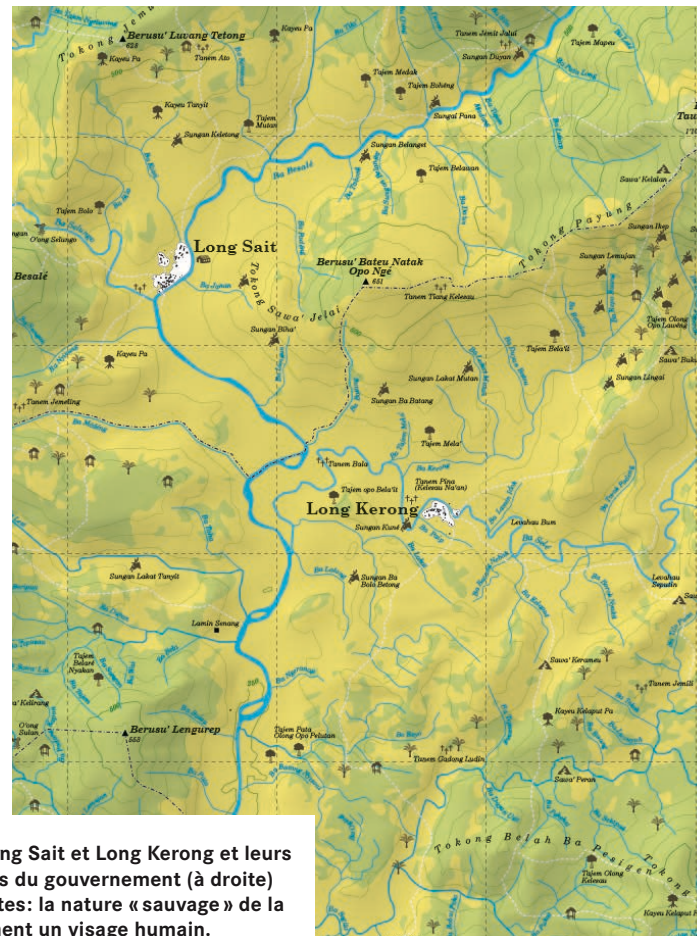
Les deux villages penans de Long Sait et Long Kerong et leurs environs, une fois sur les cartes du gouvernement (à droite) et une fois sur nos propres cartes: la nature « sauvage » de la forêt pluviale prend soudainement un visage humain.