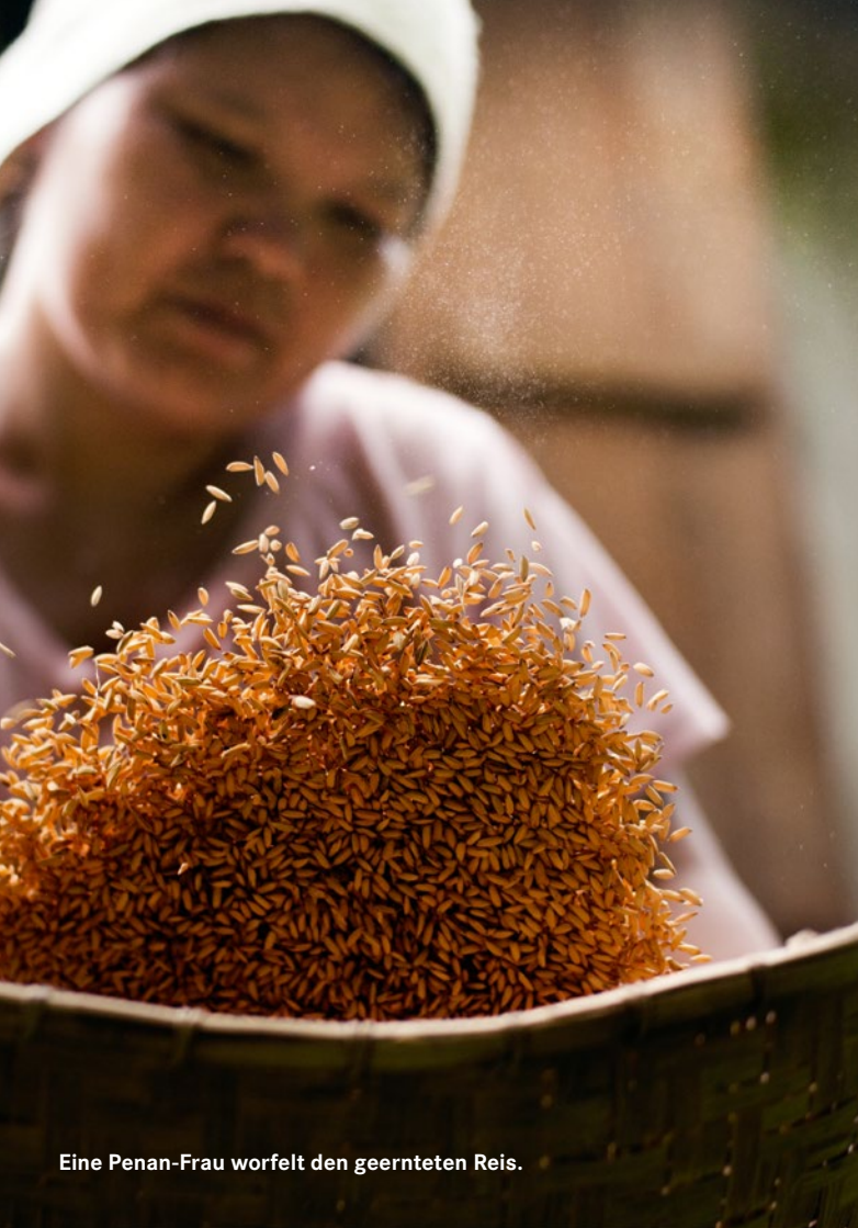
Eine Penan-Frau wirfelt den gerernteten Reis.