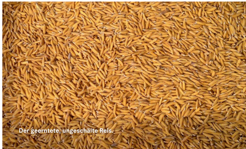
Der gererntete, ungeschälte Reis.