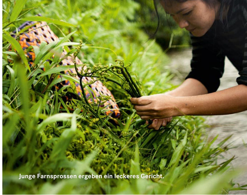
Junge Farnsprossen ergeben ein leckeres Gericht.