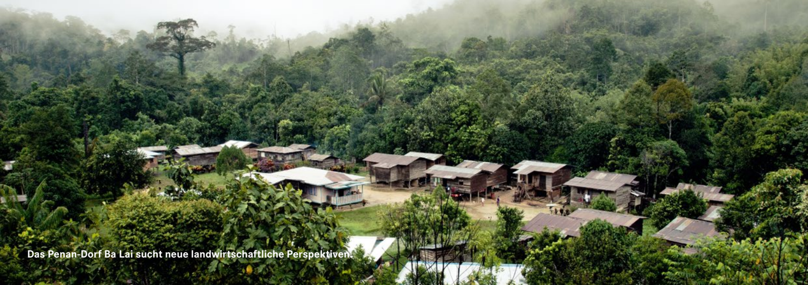
Das Penan-Dorf Ba Lai sucht neue landwirtschaftliche Perspektiven.