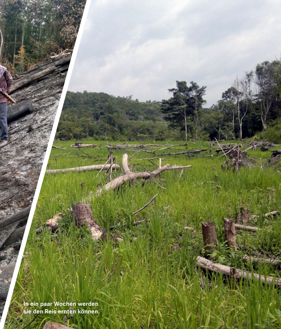
In ein paar Wochen werden sie den Reis ernten können.